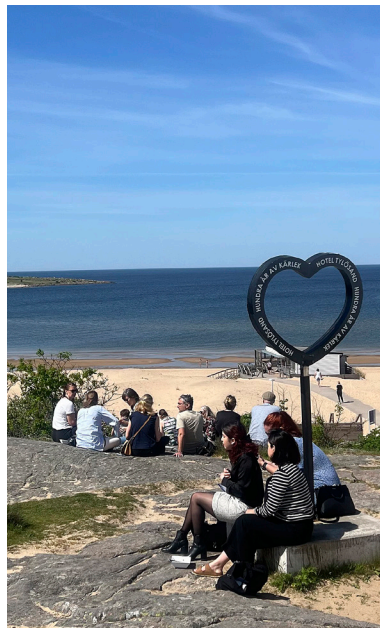
Tylösand bjöd på vårsol.